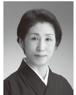
西川祐子 宗家西川流 日本舞踊家